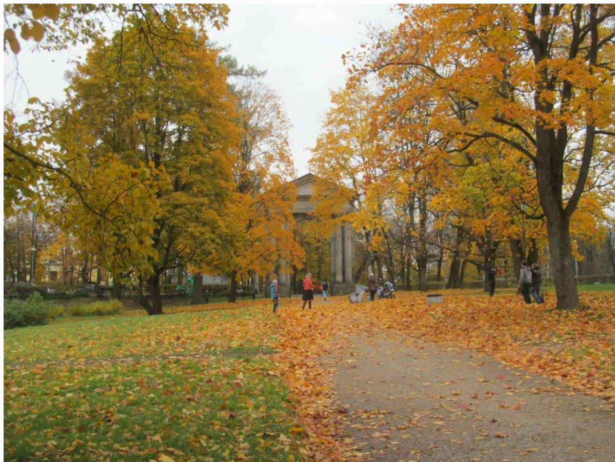
Гатчина. Начало октября 2014 года.

Заканчивающийся сентябрь порадовал нас «золотой осенью». Будем надеяться, что, несмотря на рано начавшийся листопад, «палитра модных красок» гатчинской осени сохранится и в октябре.