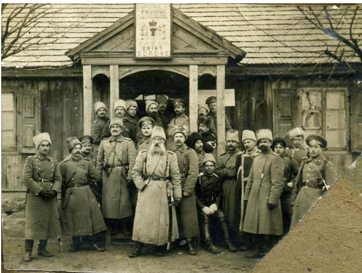
Офицеры лейб-гвардии Семёновского полка

Во время обхода, который он производил медленно, со всеми Георгиевскими кавалерами и с нашивочными он успел сказать несколько слов. И сразу было видно, что это он не номер отбывает, а искренно хочет установить связь с людьми, которых скоро ему придётся вести в бои. И что ещё больше, что ему такие разговоры не в тягость, а в удовольствие. И тут я полюбовался, как некоторые люди умели разговаривать с подчинёнными. Никакого напускного фамильярничанья и никаких Суворовских «кукуреку». Многие играли и под Суворова, но мало у кого это хорошо выходило. А тут, подойдёт и спросит, а тот, кого спрашивают, безукоризненно стоя на вытяжку, с блестящими глазами, начинает рассказывать и не может остановиться. Разговоры шли главным образом о перенесённых боях. О всех боях, где полк участвовал, Соваж уже знал в подробностях. Обход и разговоры продолжались около часу.